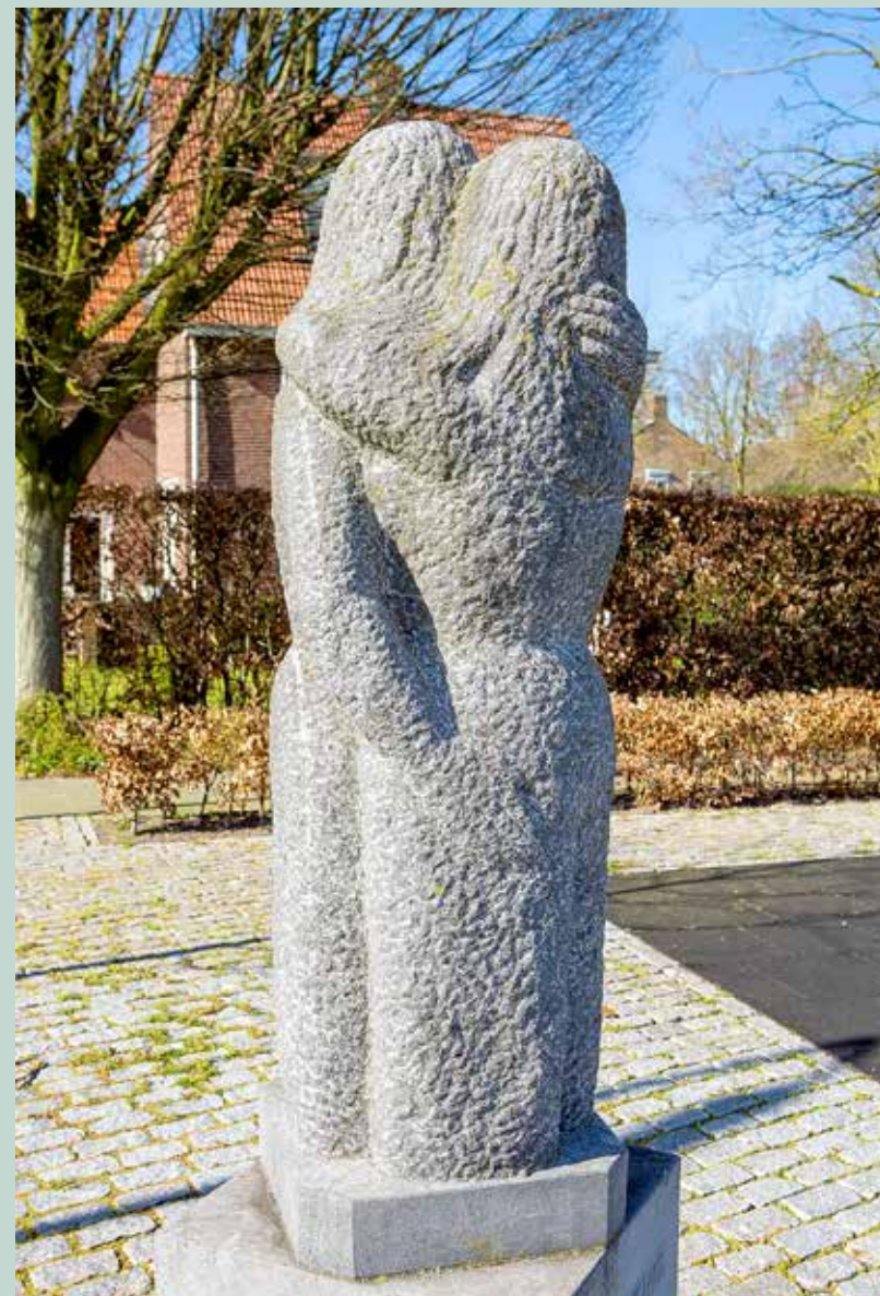
beeld "Ontmoeting", Renessplein Alphen

Vlaamse buurgemeenten over de genomen maatregelen.